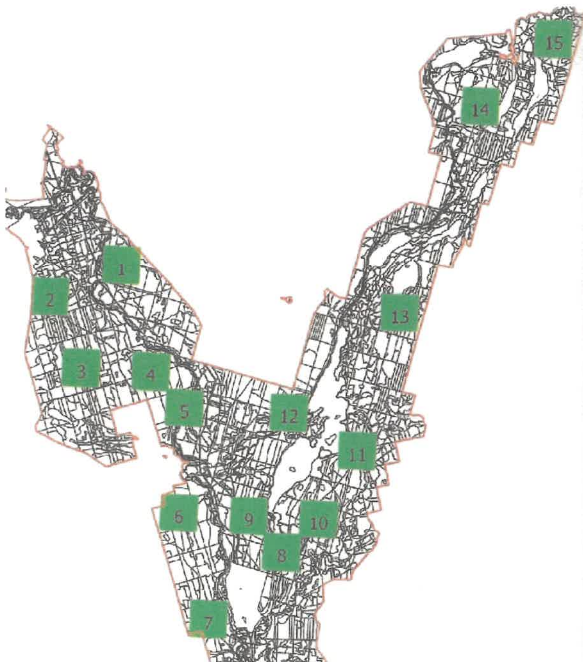
Mapka pogładowa powierzchni do MPPL